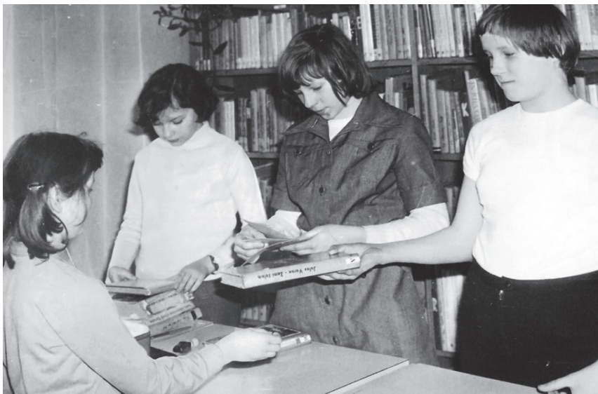
Děti půjčují dětem. Foto z dětské půjčovny 1978.