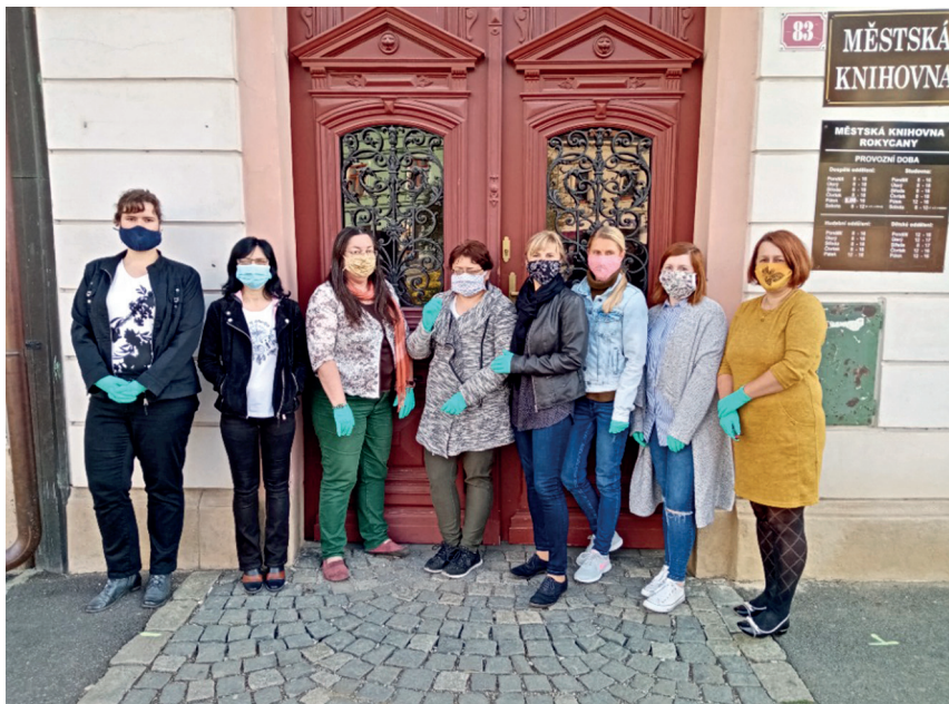
Zaměstnanci knihovny 2020.