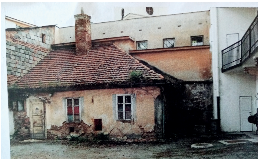
Domek správce osvětového domu v atriu knihovny byl zbořen v roce 1998. Dnes je zde prostor pro kulturní vystoupení.