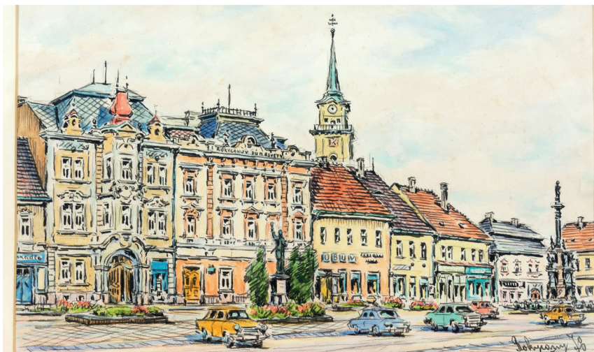
Foto: 018660/1 – pohlednice – Budova čp.83/1 na náměstí.